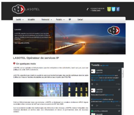
Aperçu de la version antérieure du site internet LASOTEL

Plus moderne et fonctionnel, le site www.lasotel.fr est au service des entreprises, collectivités et opérateurs. Il regroupe à la fois toutes les informations thématiques nécessaires à la mise en place de solutions télécoms techniquement abouties et positionnées sur des tarifs compétitifs, mais également de multiples articles, témoignages clients relatifs aux nombreuses préoccupations du secteur.